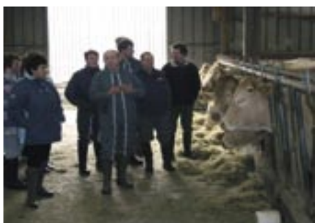
De la théorie à la pratique.

L'hiver prochain, de nouvelles sessions seront organisées par la MSA, dans le Calvados et la Manche. Si cela vous intéresse, n'hésitez pas à en faire part aux délégués MSA de votre canton ou au service Santé Sécurité au Travail de la MSA (Tel. 02 31 25 39 06)