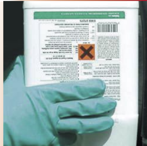
Avant toute manipulation de produits, mettez des gants adaptés.

Il est donc impératif de se protéger les mains lors de toutes les phases d'utilisation des produits phytosanitaires. Le port de gants , divise par quatre la contamination des mains dans le maraîchage. Les gants sont en nitrile et sont utilisés de façon rigoureuse. Le port d'une combinaison étanche et spécifique pour la manipulation des pesticides est nécessaire. L' usage d'un masque est indispensable dans les lieux confinés comme les serres et les vergers et lorsque l'étiquetage du produit le suggère.