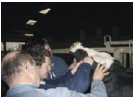
Apprendre à dispenser des soins aux animaux.

« Même après des années de métier, on apprend des choses » ou « on a appris plus que l'on en demandait » indiquent des participants qui prennent pour exemple l'écorchage des jeunes veaux : « au brûle cornes électrique, c'est vite fait » ou celui du licol en 8 : « très pratique quand on veut relâcher l'animal en toute sécurité ».